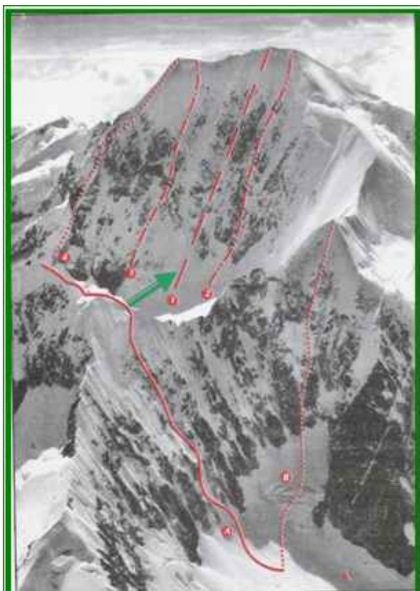
ILLAMPU Y PICO SCHULZE